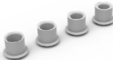
Adaptateurs de seringues de Calibration MEDIKRO ®