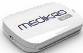
MEDIKRO® Pro Produktkode: M9488