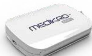
MEDIKRO® Primo Produktkode: M9492