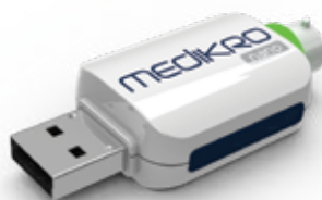
MEDIKRO® Nano Produktkode: M9487