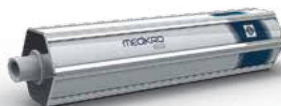
MEDIKRO® Siringa di calibrazione

Codice prodotto: M9474 (3L) / M9477 (1L)