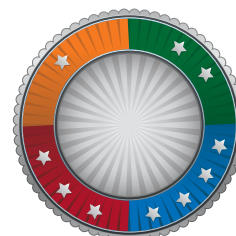
MEDIKRO® Garanti og service