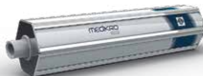
MEDIKRO® Jeringa de calibración Código de producto: M9474 (3L) / M9477 (1L)