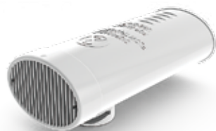
MEDIKRO® SpiroSafe Código de producto: M9256