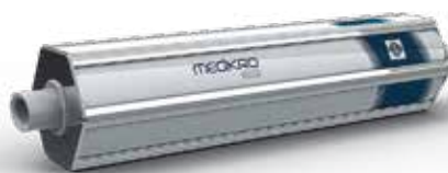
MEDIKRO® Калибровочный шприц