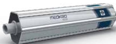
MEDIKRO® Siringa di calibrazione

Codice prodotto: M9474 (3L) / M9477 (1L)