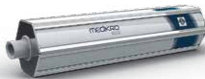
Seringue de calibration MEDIKRO®