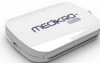
MEDIKRO® Primo Produktkod: M9492